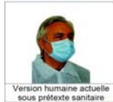
Version humaine actuelle sous prétexte sanitaire