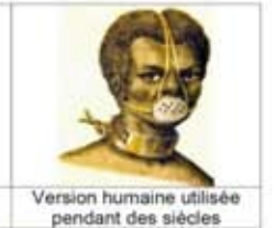
Version humaine utilisée pendant des siècles